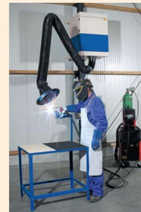
Exemple d'application : CAREMASTER montage mural avec plaque tuyère d'aspiration supplémentaire montée dans la hotte d'aspiration