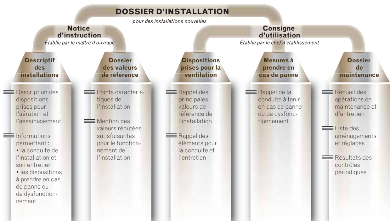
Figure 1 • Description du dossier d'installation à mettre en œuvre dans le cas d'installations nouvelles.